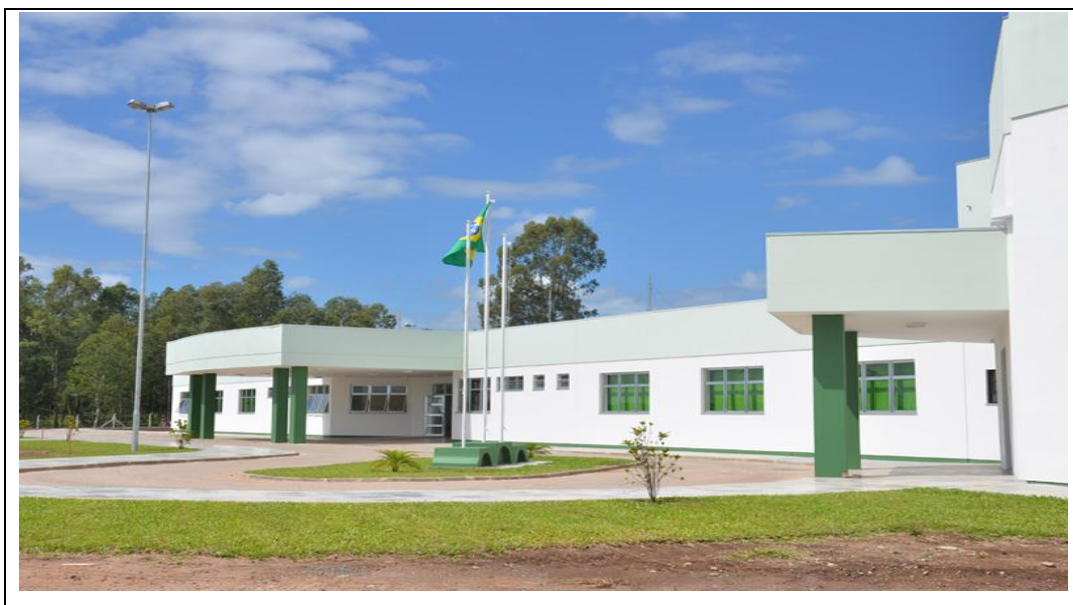
Figura 1 – Vista frontal do IFSul Câmpus Venâncio Aires